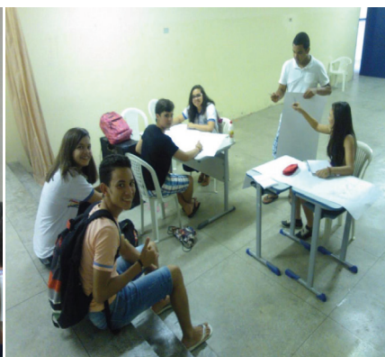
FIG. 7 – Alunos no auditório da escola confeccionando cartazes.