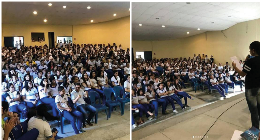
FIG. 3 e 4 – Vista parcial da realização de um Café Filosófico no auditório da EREM Benedita de Moraes Guerra, Macaparana/PE. (2018)