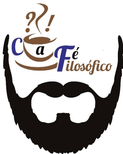
FIG. 1 – logomarca do Café Filosófico