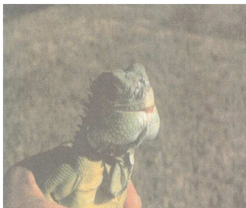
Aumento de volume na região mandibular em Iguana. F

Essa substituição resulta em ossos aumentados de volume, porém estruturalmente frágeis, caracterizando o aspecto clínico clássico da doença, como a chamada "mandíbula de borracha" (Figura 1). Histologicamente, observa-se redução acentuada da mineralização, espaços medulares ampliados e deposição excessiva de fibras colágenas, refletindo o estágio final da patologia (NASCIMENTO et al. , 2016; MELO et al. , 2019).