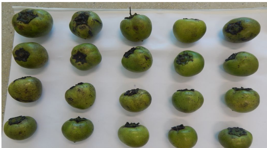
Figura 1. Saptotas-pretas procedentes do Estado do Ceará para caracterizações químicas e físicas. IFPB, 2016.

Os frutos foram selecionados no estágio de completa maturação fisiológica, prontos para consumo (Figura 1), com critérios sugeridos por Freire et al. (2012).